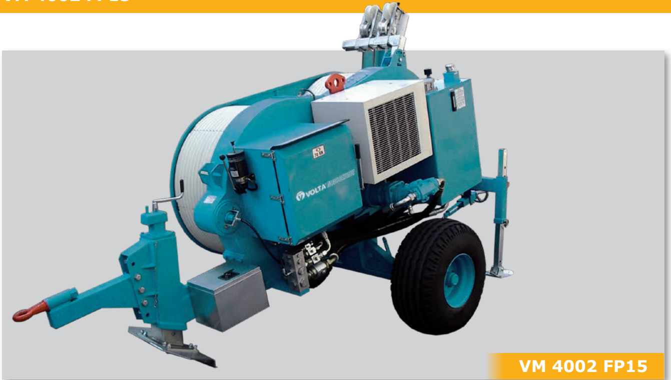
VM 4002 FP15