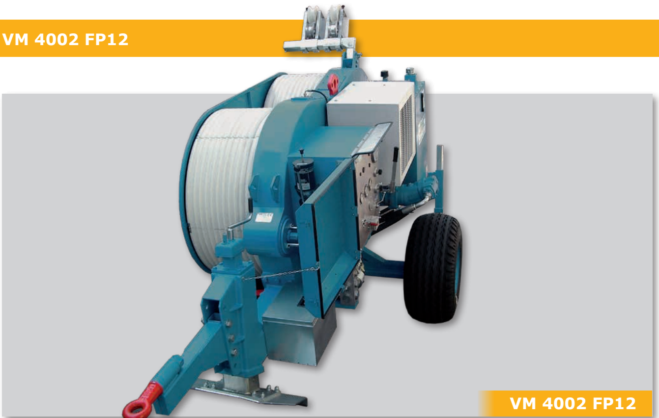
VM 4002 FP12