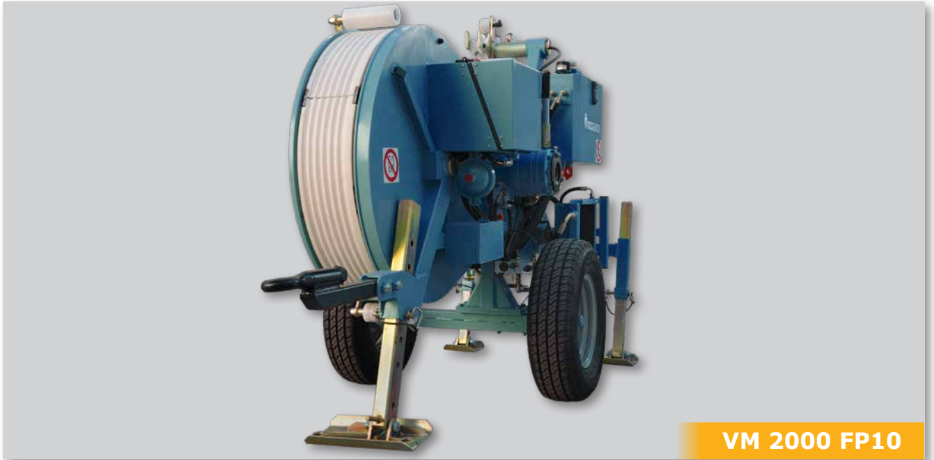
VM 2000 FP10