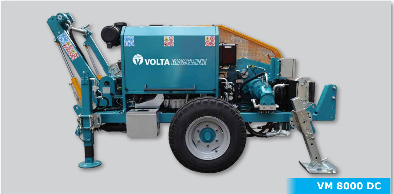
VM 8000 DC